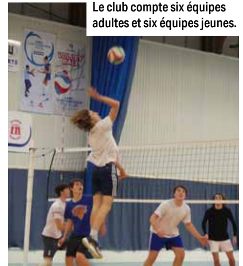
Le club compte six équipes adultes et six équipes jeunes.