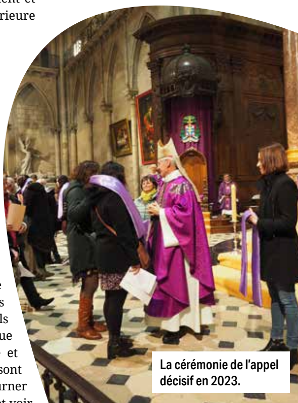
La cérémonie de l'appel décisif en 2023.

leur désir d'être baptisés à sa lumière. Célébrés au cours de la messe dominicale, ces rites d'une grande simplicité sont une belle occasion pour la communauté qui les entoure de scruter aussi son cœur et de se préparer à vivre la résurrection avec le Christ au moment de Pâques !